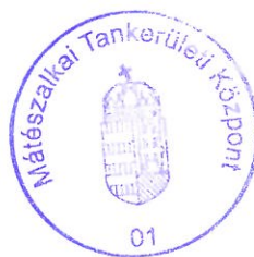
Pesti Béla László